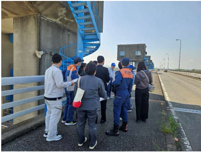
管理橋の確認状況