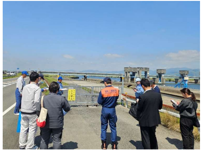
左岸側侵入防止施設の確認状況